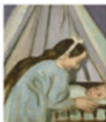
Le Berceau du petit frère Denis Maurice 1915 DOC DFMD 2010.5