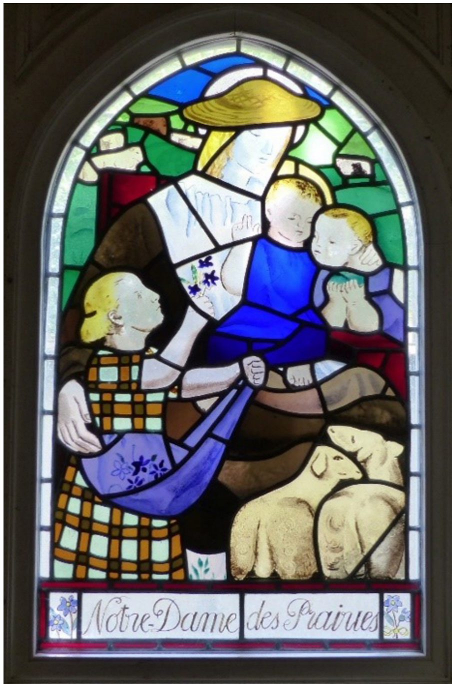
Pauline Peugniez, Notre-Dame des Prairies , vitrail, musée M. Denis.